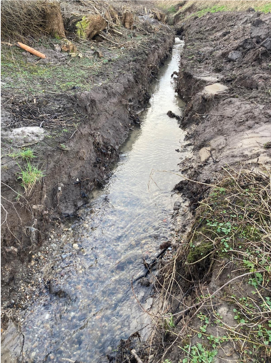
Foto 6: Taget den 20. februar 2024. Billedet er taget i modstrøms retning op mod Skamlingvejen. Billedet viser det frilagte vandløb. Billedet er taget omtrent samme sted som foto 3, hvor vandløbet endnu ikke var frilagte.