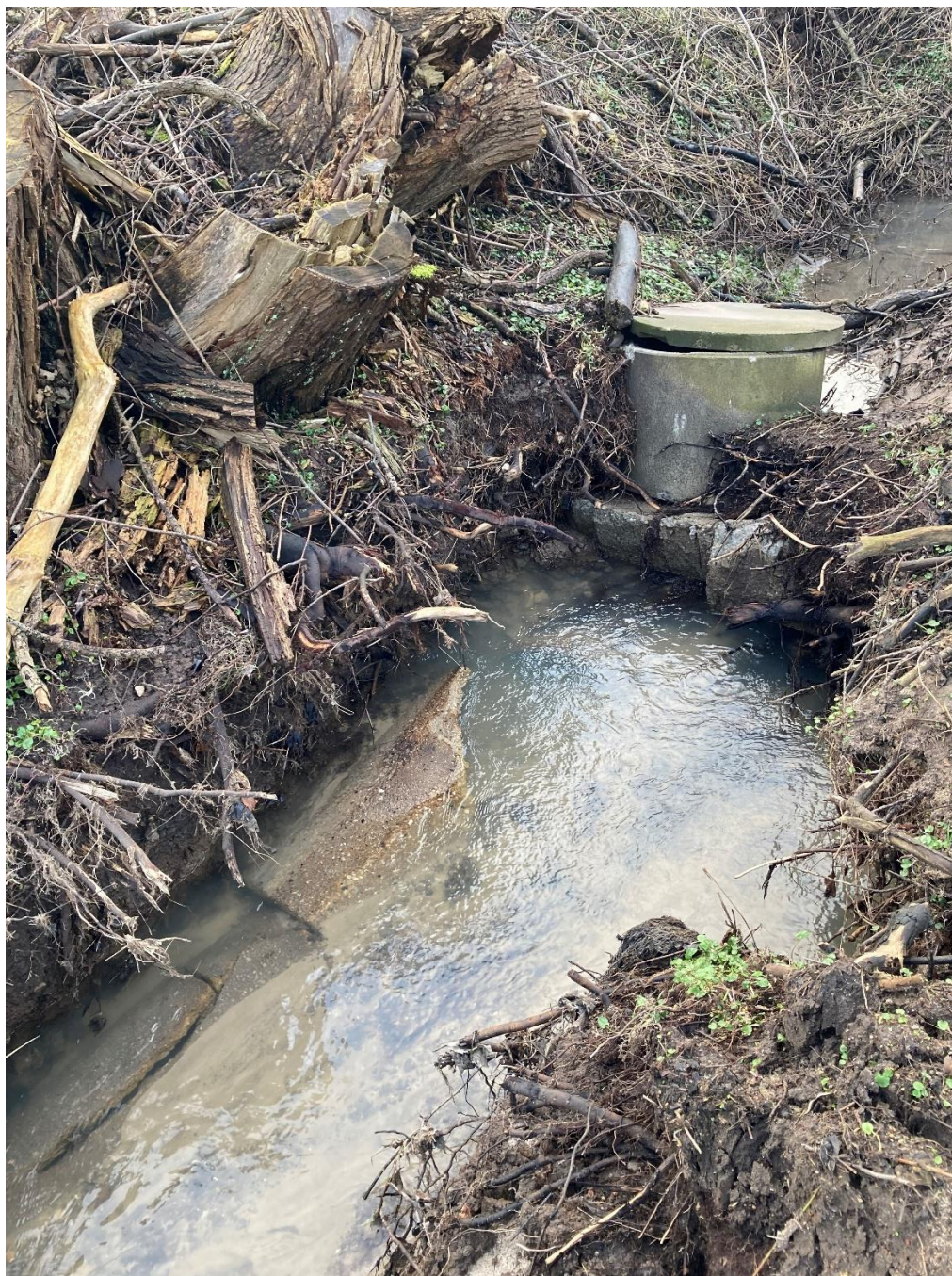
Foto 7: Taget den 20. februar 2024. Billedet er taget i modstrøms retning op mod Skamlingevejen. Billedet viser den brønd, der ligeledes ses på foto 4. Den nye vandløbsbund skal etableres i samme bundkote som koten på det rør, der tidligere har løbet ud af brønden.