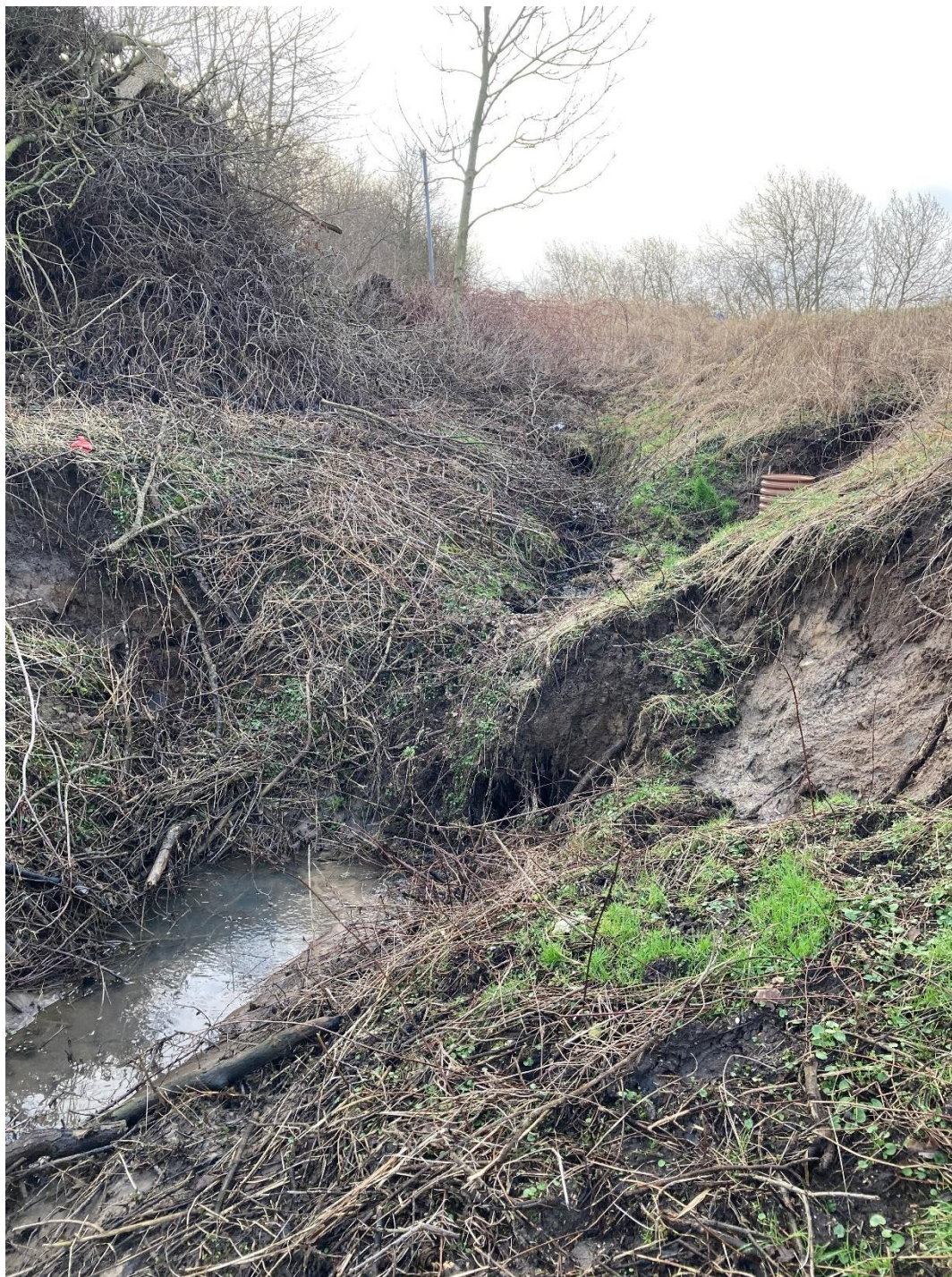
Foto 9: Taget den 20. februar 2024. Billedet er taget i modstrøms retning op mod Skamlingvejen. Billedet viser den blandt andet den orange brønd, der ligeledes kan ses på foto 4.