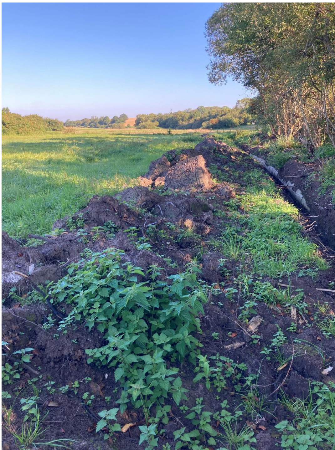
Foto 2: Taget den 4. september 2023. Billedet er taget omtrent samme sted som foto 1. På billedet ses overskudsjord fra opgravningen. Jorden her skal fjernes fra den beskyttede eng.