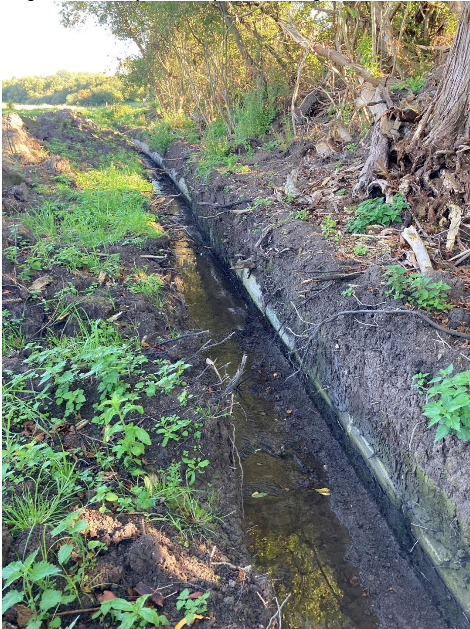
Foto 1: Billedet er taget den 4. september 2023 omtrent midt på den pågældende vandløbsstrækning i medstrøms retning. På billedet ses rørledningen på den østlige side af vandløbet.