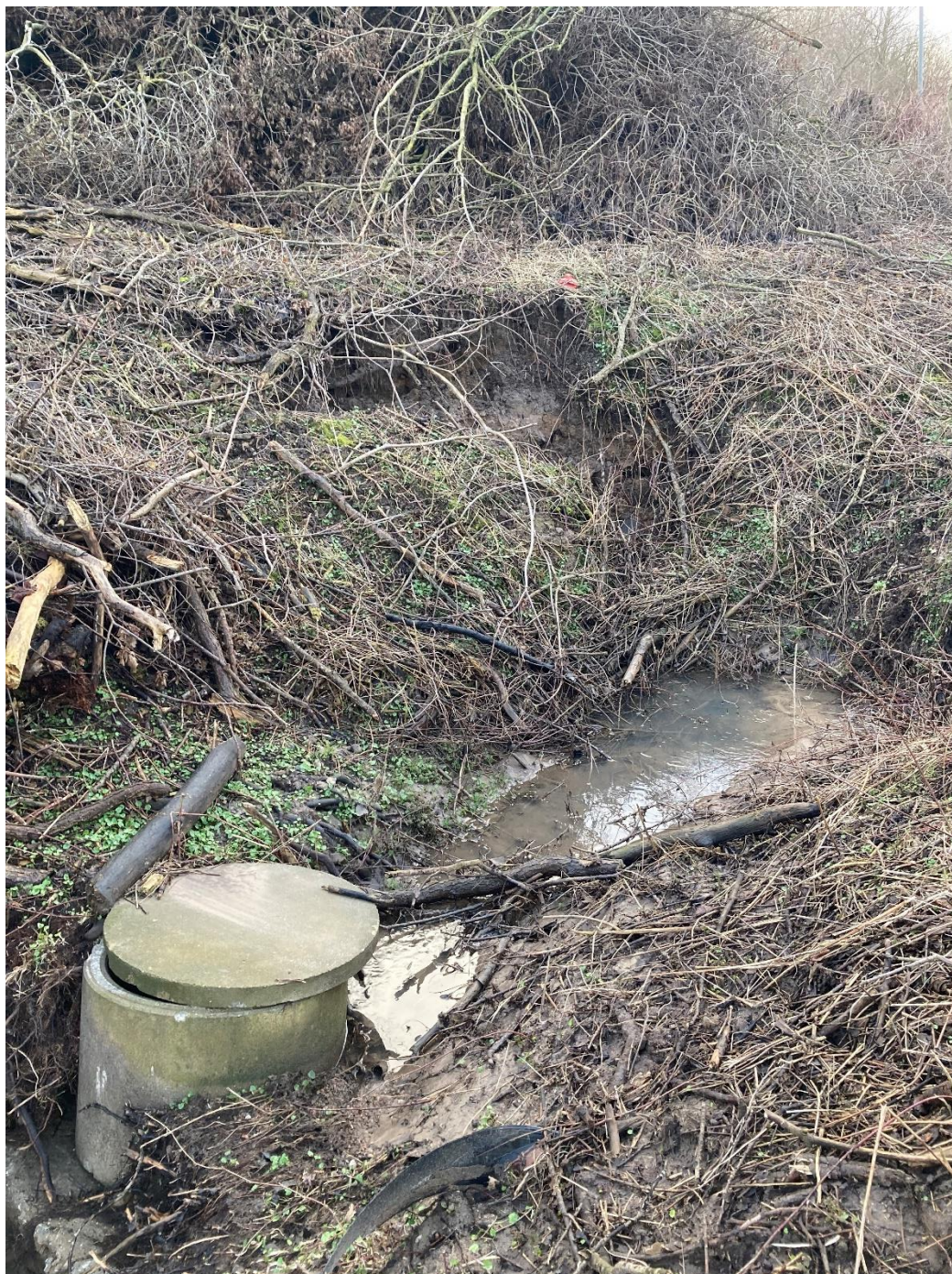
Foto 8: Taget den 20. februar 2024. Billedet er taget i modstrøms retning op mod Skamlingvejen. Billedet viser den brønd, der ligeledes ses på foto 4 og foto 7.