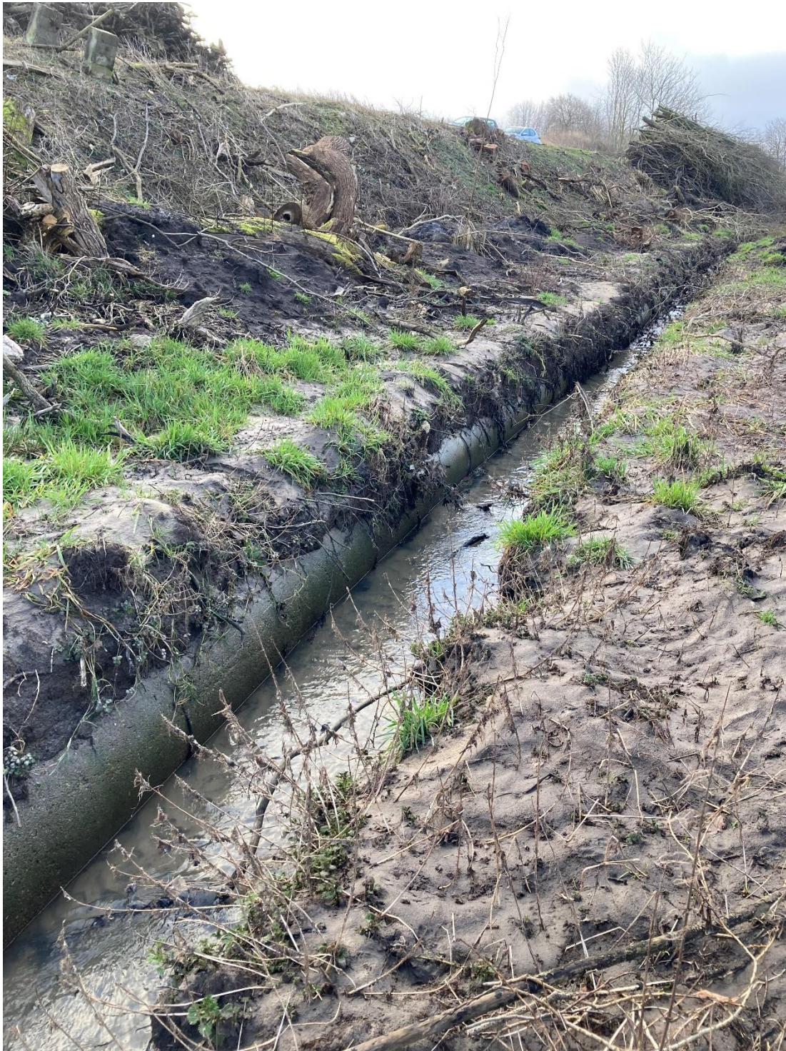
Foto 5: Taget den 20. februar 2024. Billedet er taget i modstrøms retning ca. midt på den omhandlede vandløbsstrækning på matr.nr. 4n Skartved By, Sdr. Bjert. Billedet viser det frilagte vandløb og de tilbageværende rør øst for vandløbet.