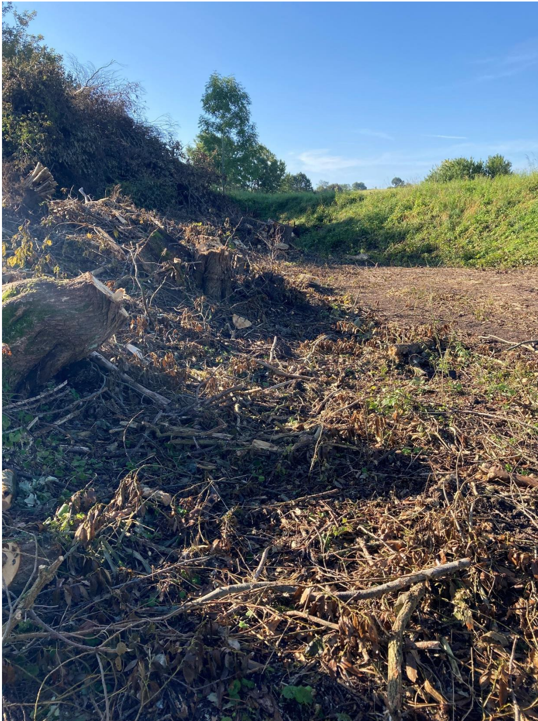
Foto 3: Taget den 4. september 2023. Viser strækningen op mod Skamlingvejen. Her er vandløbet endnu ikke blevet frilagt.