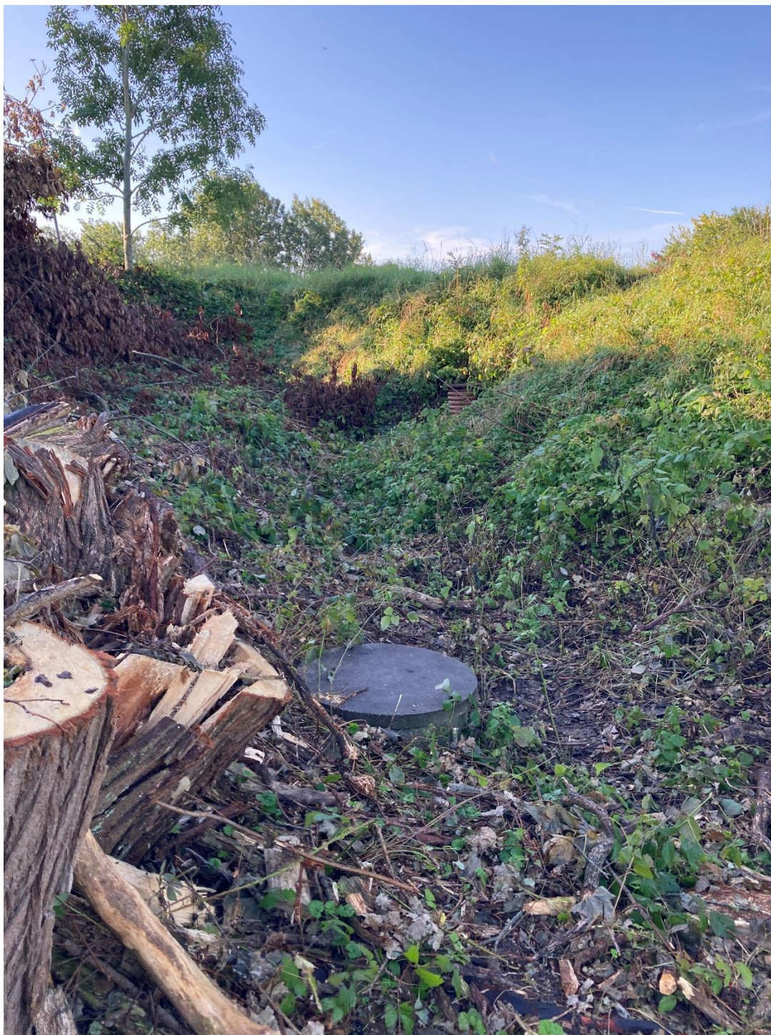
Foto 4: Taget den 4. september 2023. Viser strækningen op mod Skamlingvejen. På billedet ses to brønde – forrest en brønd med gråt brønddæksel, bagerst orange brønd.